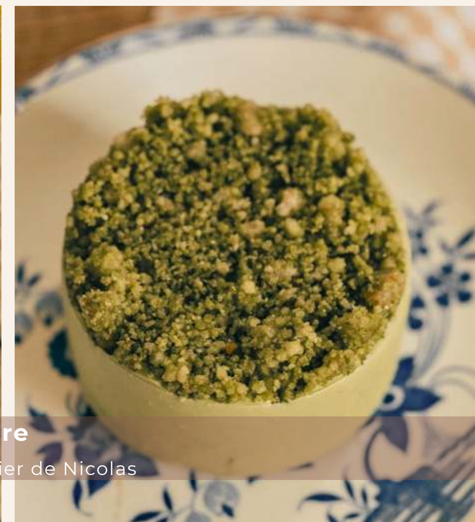
Onze culinaire Dessert by l'Atelier de Nicolas